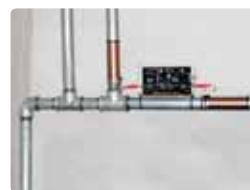
Instalación en interiores