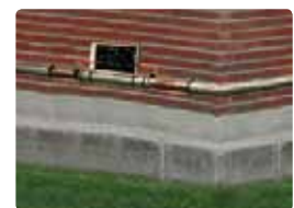
Instalación en exteriores